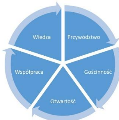
Rys. 3. Filary MISJI Krakowa w zakresie turystyki.

MISJA władz lokalnych Krakowa w obszarze rozwijania turystyki opiera się na następujących filarach (rys. 3):