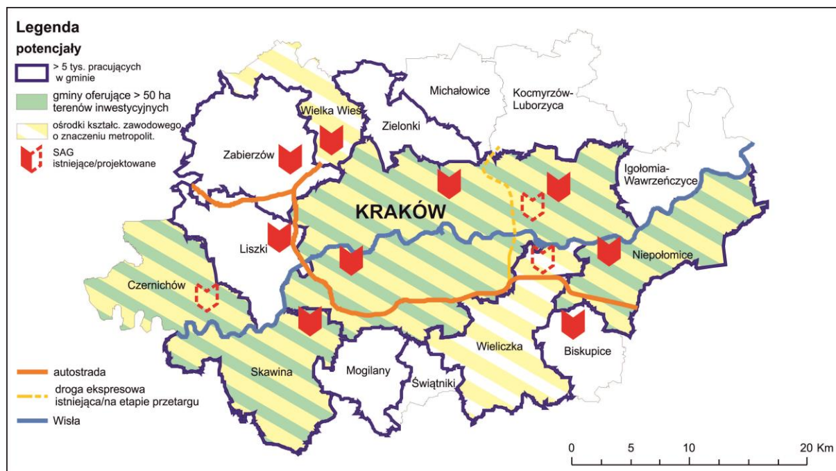
Rysunek 2. Terytorialne zróżnicowanie potencjałów rozwojowych KrOF (nawiązujących do celów Strategii ZIT)