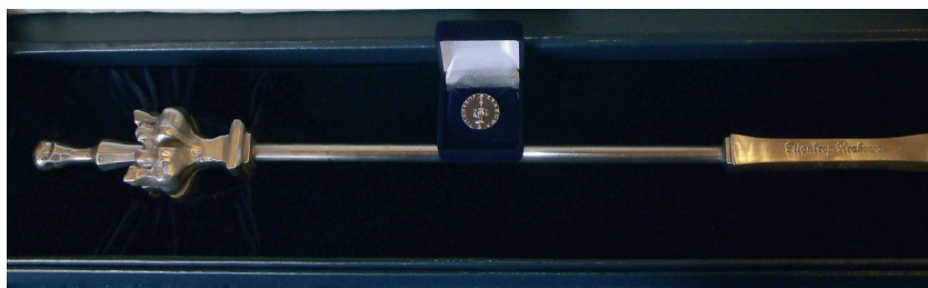
Replika berła św. Królowej Jadwigi i znaczek Filantrop Krakowa