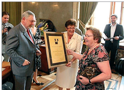
Mecenas Kultury Krakowa

Centrum Witek oddaje do Państwa dyspozycji 35 tys. m 2 powierzchni ekspozycyjnej. W przestronnym wnętrzu podzielonym na działy: meble klasyczne, nowoczesne i stylowe odnajdziecie Państwo wymarzone meble do swojego wnętrza. Pracownicy Centrum pomogą w wyborze mebli i dodatków a także w załatwieniu wszelkich formalności zakupowych.