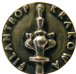
Znaczek Filantrop Krakowa