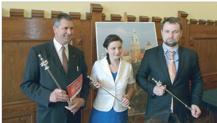
Filantrop Krakowa A.D. 2012