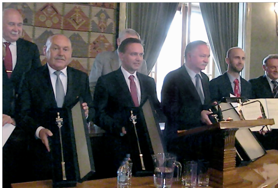
Filantrop Krakowa A.D. 2013