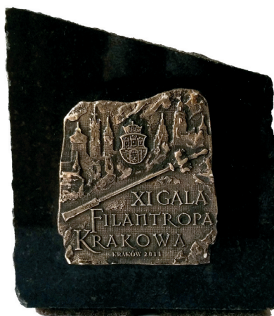
Mini statuetka Filantrop Krakowa