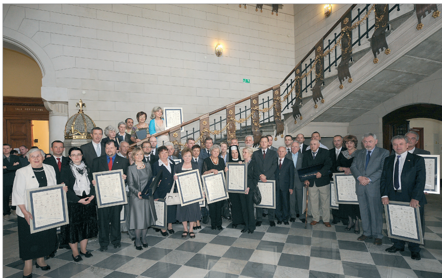
Filantrop Krakowa A.D. 2009 połączony z X jubileuszową edycją konkursu Filantrop Krakowa