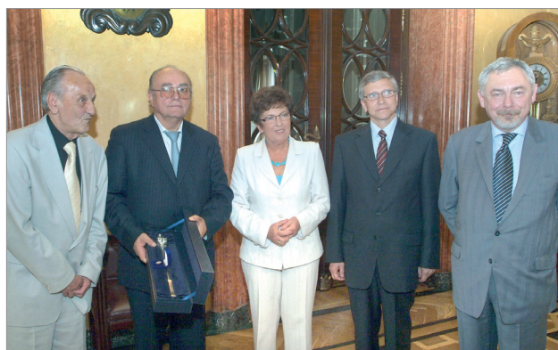
Filantrop Krakowa A.D. 2007