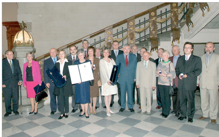
Filantrop Krakowa A.D. 2005