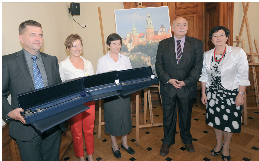
Filantrop Krakowa A.D. 2010