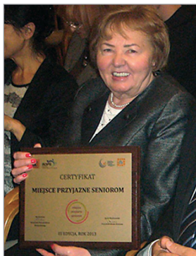
Cafe Caroline – Miejsce Przyjazne Seniorom

Firmę wyróżnia nie tylko dbałość o Klientów i ich zadowolenie, ale również ciągłą i nieustającą pomoc charytatywną, zarówno dla instytucji jak i osób prywatnych. Jednym z wielu osiągnięć, jest wybudowanie studni w Sudanie, coroczne fundowanie stypendiów dla zdolnych dzieci z biedniejszych rodzin, których bez pomocy marzenie o studiach nigdy by się nie spełniło. Wsparcie organizacji charytatywnych, pozarządowych przez przekazywanie fantów na loterie, fundowanie nagród w konkursach oraz finansowo.