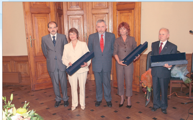
Filantrop Krakowa A.D. 2004