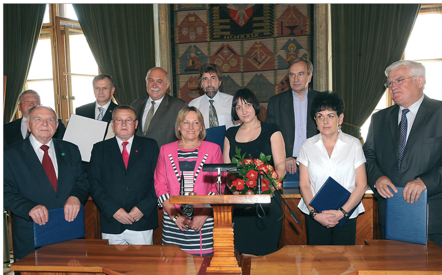
Filantrop Krakowa A.D. 2011