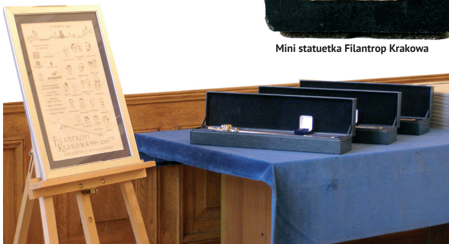
Okolicznościowy plakat X edycji Filantrop Krakowa i Replika berła św. Królowej Jadwigi