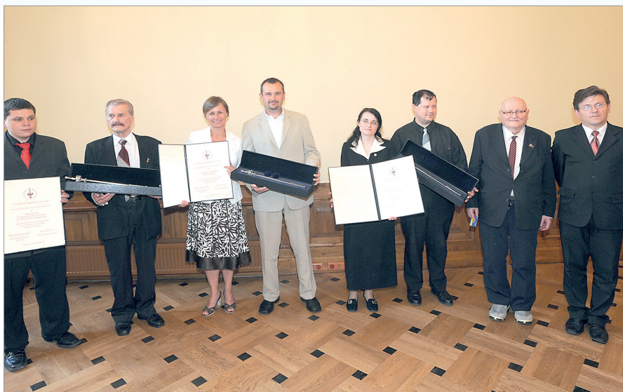
Filantrop Krakowa A.D. 2008