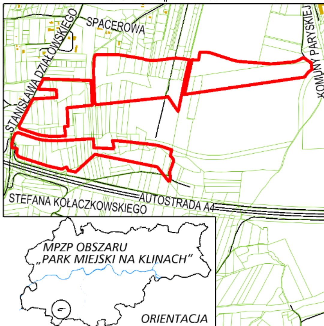
Zał. 1 mapka Park miejski na Klinach , Źródło https://www.bip.krakow.pl/