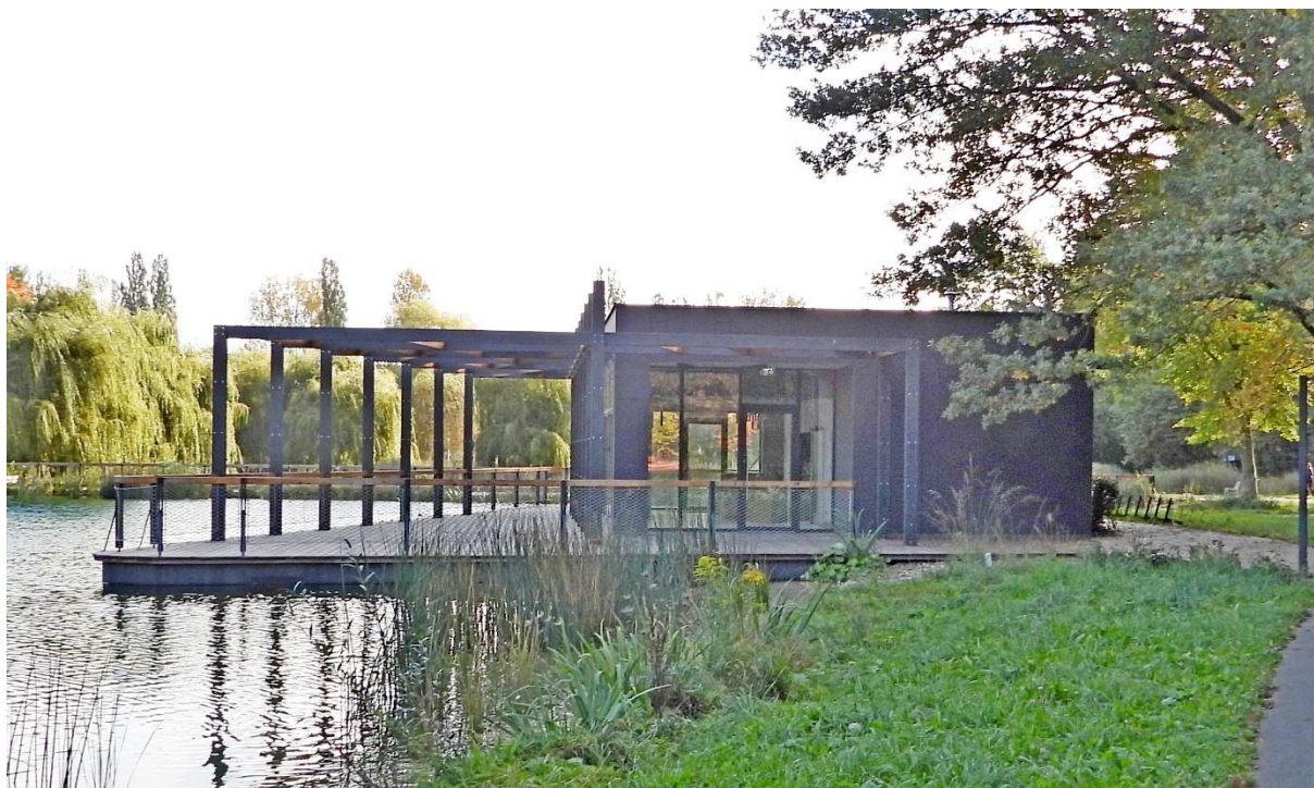
Fot. 2. Pawilon na widzie w Parku Lotników Polskich. Widać efekt "przestrzeni na przestrzał".