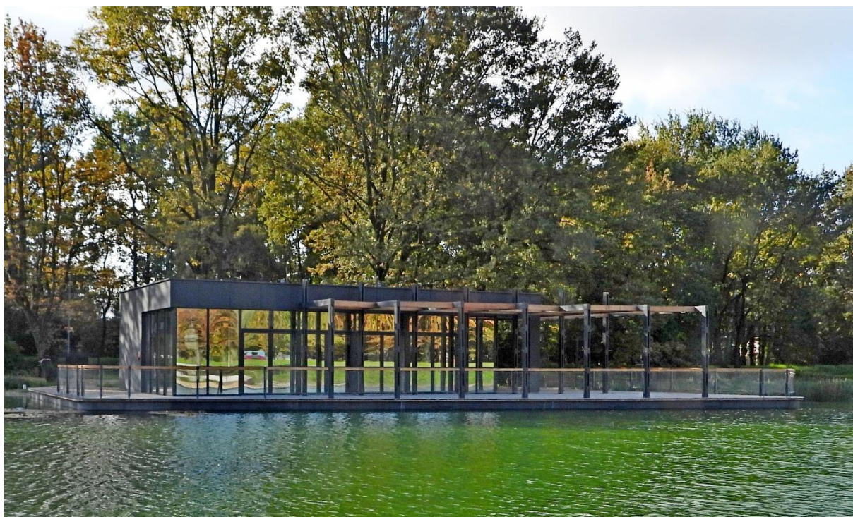
Fot. 1. Pawilon na wodzie w Parku Lotników Polskich. Widać efekt lustra na szklanych ścianach pawilonu.

Konieczne jest natychmiastowe oklejenie szyb pawilonu, ze wszystkich 4 boków z pomocą rozproszonych punktów, np. jak wykonuje to fundacja "Szlana Pułapka", za pomocą pionowych pasków, jak wiele takich zabezpieczeń wykonał Zarząd Dróg Miasta Krakowa na przezroczystych ekranach akustycznych. Można też wykonać oklejenie, zabezpieczenie szyb pawilonu przed zderzeniami z ptakami z pomocą folii dziurkowanej OWV (Folia One Way Vision). Oklejenie z pomocą tej folii sprawia, że naklejone oznakowania, paski, punkty, inne są dobrze widoczne z zewnątrz pawilonu, natomiast osoby przebywające wewnątrz, praktycznie ich nie widzą. Jest to rezultat specjalnej konstrukcji takiej folii. Jest stosowna powszechnie w oklejaniu witryn sklepowych.